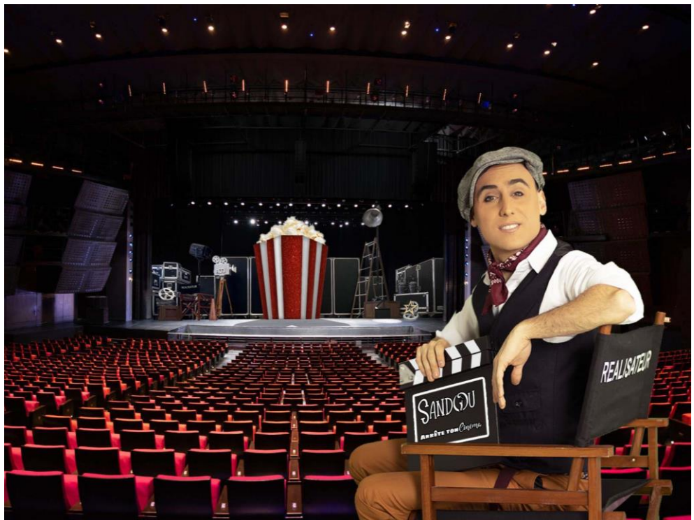
Quand le cabaret fait son quick-change ! De Broadway à Hollywood, de Charlie Chaplin à Tim Burton, en passant par les films et séries de Netflix... Silence, caméra, ça tourne, et... Action !

Je pense que le cinéma, les films et la magie ont toujours été étroitement associés. Les premiers à avoir fait du cinéma étaient des magiciens. Oui, au cinéma on peut faire apparaître l'impossible par l'imagination ! On peut même faire apparaître la pluie comme le beau temps... La pluie ! Gene Kelly dans ce film musical de 1952 qui raconte l'histoire de la transition du cinéma muet au cinéma parlant ! Sa performance dans la célèbre scène de la danse sous la